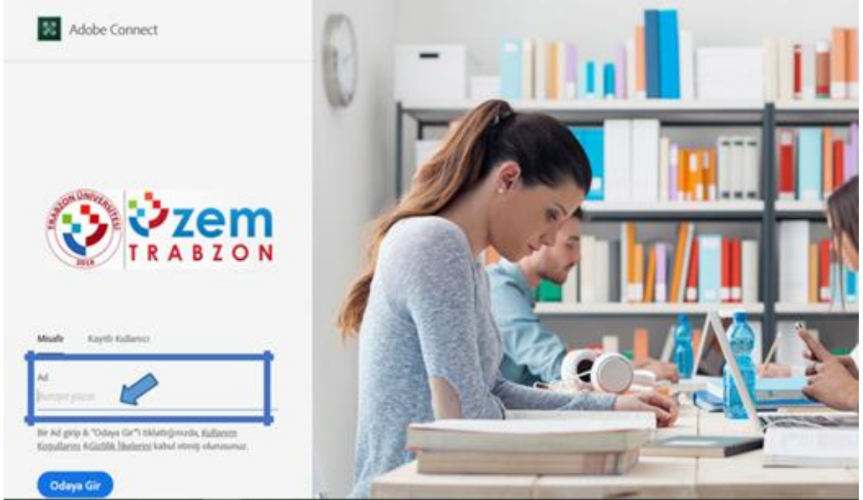
Resim 1. Giriş arayüzü