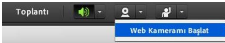
Resim 4. Görüntülü Katılım

Görüntülü katılım izni size verildiğinde, Resim 4’te görüldüğü üzere ekranınızın sol üst bölümünde yer alan “kamera” simgesine tıklayarak veya açılan pencerede “Web Kameramı Başlat” butonuna tıklayarak görüntüsünün ön izlemesini görebilir. Ardından, görüntünüz üzerinde yer alan “paylaşımı başlat” butonuna basarak görüntünüzü diğer katılımcılara aktarabilirsiniz.