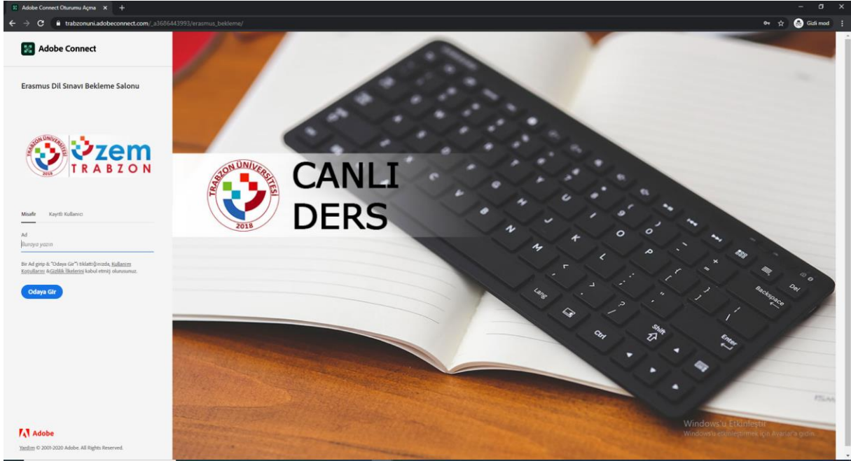
Resim 1. Giriş arayüzü